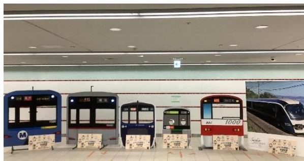
各社局のモックアップ (昨年のももの)